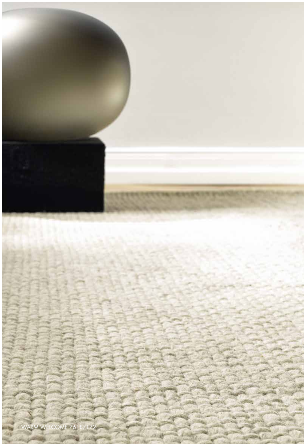
WARM WELCOME 7618/172

Der Tabelle entnehmen Sie bitte, welchen Light & Shade Teppich Sie in runder, eckiger oder in beiden Formen bestellen können. Selbstverständlich immer handgewebt und in den Maßen Ihrer Wahl.