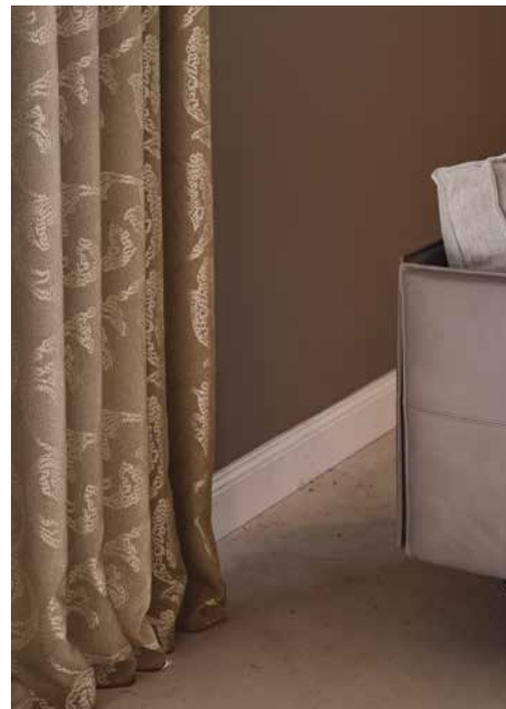
GOYA GS1011-020, NINA ECO GS4053-074, FANCY THERMO GS3006-061, -081, -022