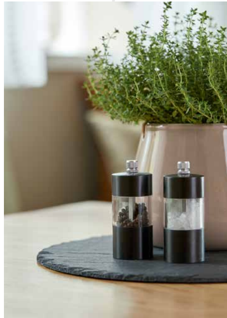
HUBERTUS FR GS7002-030, ROMY FR GS7004-030, LUNAR FR DIMOUT GS8002-061, -031, -032, -062