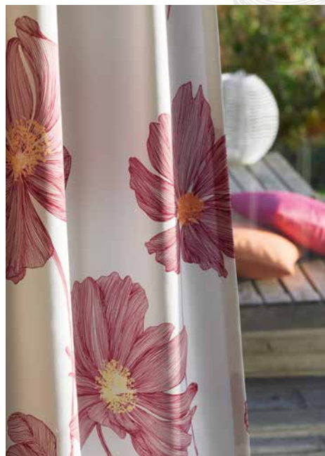
SCARLET GS1015-060, VIRGINIA 280 VOL. 2 GS3002-060, -068