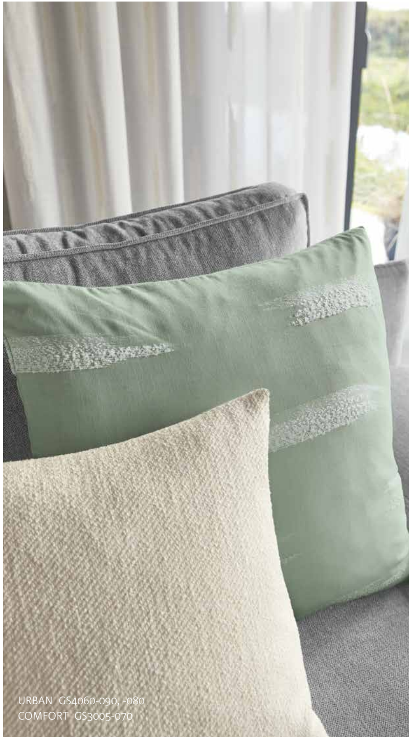
URBAN GS4060-090, -080 COMFORT GS3005-070