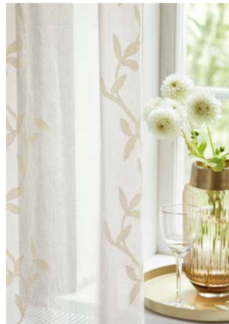
CECILE GS4066-040, EMILIA GS1012-020, LONDON GS4061-040, THERMI SOFT GS3007-071