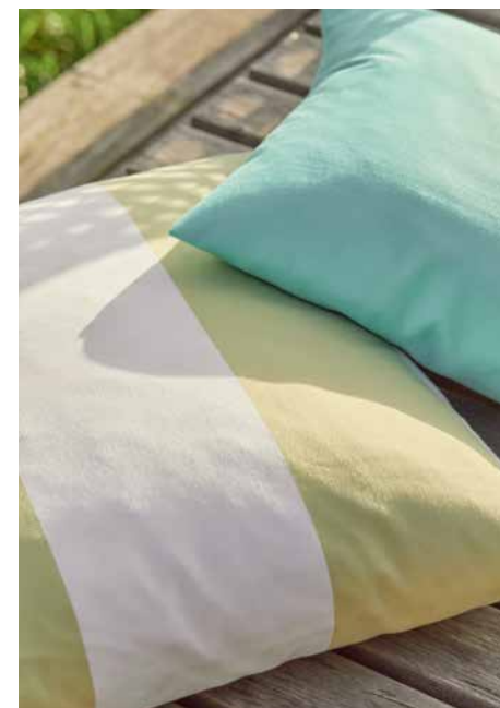
VIRGINIA 280 VOL. 2 GS3002-061, -065, -033, -088, MARTINIQUE GS1014-060, COMFORT GS3005-090, HOLIDAY STRIPE GS1013-031, -061