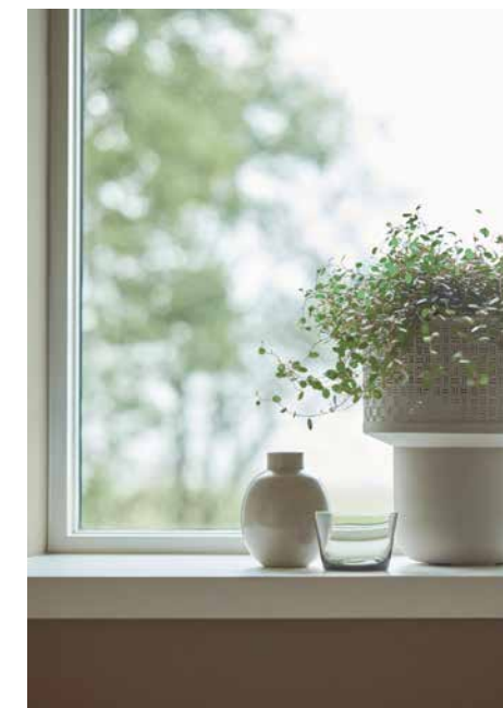
PEARL GS4069-074, -070