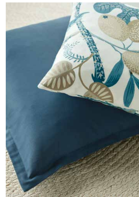
HOLIDAY STRIPE GS1013-051, -071 VIRGINIA 280 VOL. 2 GS3002-070, -059, MARTINIQUE GS1014-050, THERMI SOFT GS3007-090