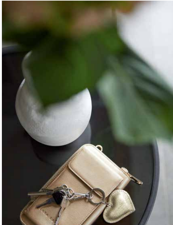
DATA GS4059-091, COMFORT GS3005-092