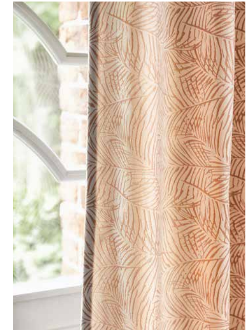
SANTANA THERMO GS1008-060