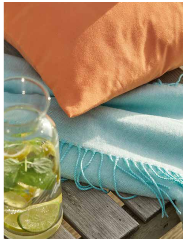
VIRGINIA 280 VOL. 2 GS3002-033, -070, -067, HOLIDAY STRIPE GS1013-080, -061, -030, MARTINIQUE GS1014-030