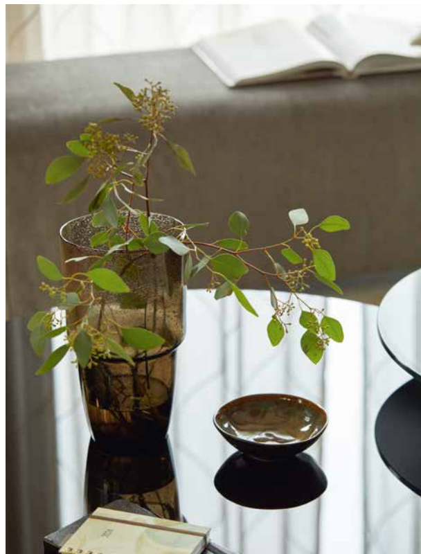
HOLIDAY STRIPE GS1013-092